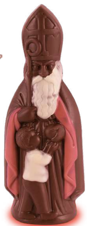
Moulage Saint Nicolas au chocolat au lait

Poids : 110 g - Réf. : 403 Dimensions : 175x65x50 mm